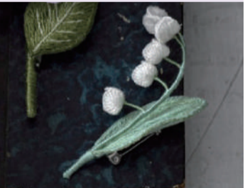
【花々と小物であやなす立体刺繍】 日本文芸社刊