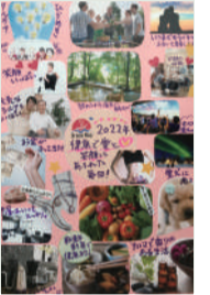
※仕上がりサイズ(78cm×54cm程度)